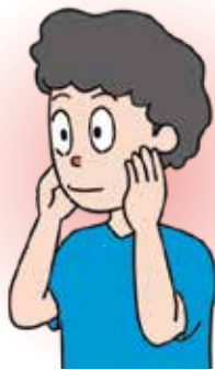
耳下腺 (耳の前で円を描くように)

食事の前に行い唾液の分泌を促すと、食べ物が食べやすくなります。各唾液腺を5~10回指で軽くマッサージします。