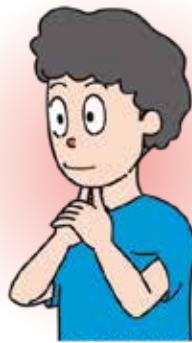
舌下腺 (親指で舌を押し上げるように)