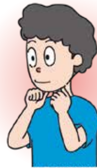
顎下腺 (顎のラインに合わせて後ろから前へ)